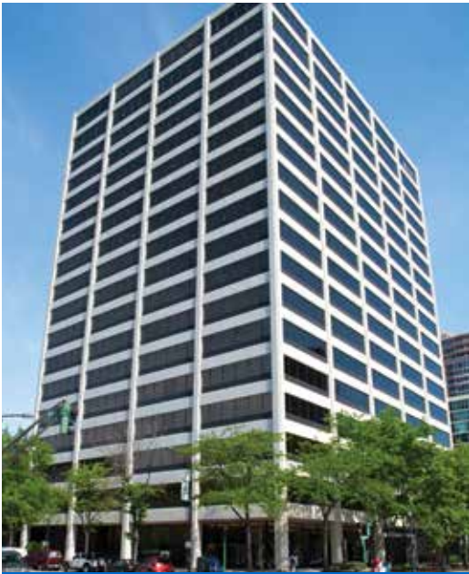
One Rotary Center in Evanston, Illinois, USA

Das Sekretariat von Rotary International ist für die Verwaltung der Organisation zuständig. Ihm gehören der Generalsekretär und rund 800 Mitarbeiter an, deren Aufgabe die Unterstützung der Clubs und Distrikte in der ganzen Welt ist. Das Zentralbüro von Rotary hat seinen Sitz in Evanston im US-Bundesstaat Illinois in einem Gebäude mit dem Namen One Rotary Center . Es gibt hier ein Auditorium mit 190 Plätzen und auch die Archive von Rotary befinden sich hier. Auf der Vorstandsetage befinden sich Konferenzräume für den Zentralvorstand und das Kuratorium der Rotary