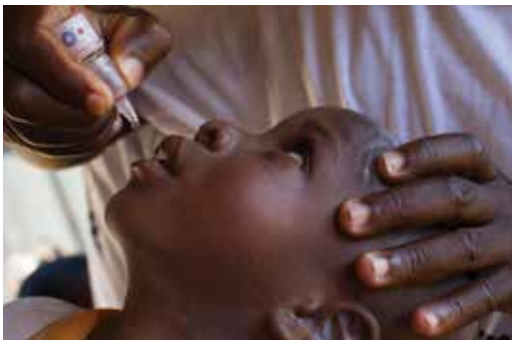
Rotarier impft ein Kind gegen Polio in Nigeria

Die Spenden unserer Mitglieder und anderer für die Foundation machen es möglich, dass wir nachhaltige Änderungen in Not leidenden Gemeinwesen bewirken können. Fragen Sie den Rotary-Foundation-Beauftragten Ihres Clubs, wie Sie unsere Stiftung unterstützen können