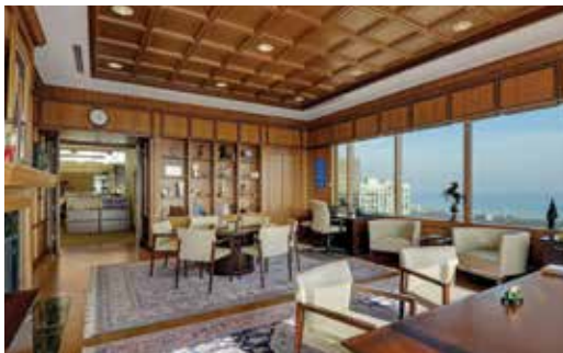
Büro des Präsidenten von Rotary International