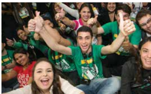
Rotaracter bei ihrem Jahrestreffen.

Wir fördern junge Führungskräfte mit der Entwicklung von Führungsqualitäten und durch die Teilnahme an interkulturellen Erfahrungen in der Überzeugung, dass wir damit in unsere Zukunft investieren.