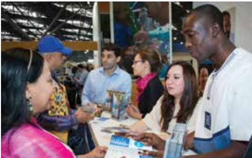
Rotary ist ein Netzwerk aus Mitgliedern in aller Welt, die Ideen austauschen und aktiv werden.

Rotarische Aktionsgruppen (Rotarian Action Groups oder RAGs) beraten Clubs und Distrikte fachlich bei der Planung und Umsetzung von Großprojekten. Die Fachexperten der RAG Wasser und Hygiene beispielsweise zeigen Clubs und Distrikten, wie sich mit Wasser- und Abwasserprojekten eine große Wirkung erzielen lässt. Die RAG Rotarians for Family Health and AIDS Prevention mobilisieren Rotarier und Rotarierinnen, um Tausenden von Menschen in unterversorgten Gemeinden umfassende Gesundheitsleistungen und Untersuchungen zu niedrigen Kosten zu ermöglichen. Näheres dazu finden Sie auf rotary.org/actiongroups .